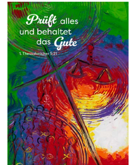
Acrylmalerei von Doris Hopf

Ab Mitte Juni werde ich bis voraussichtlich Januar 2026 in Elternzeit gehen, damit meine Frau ihr Vikariat weiter absolvieren kann. Propst Fey hat bereits signalisiert, dass es für die Zeit eine