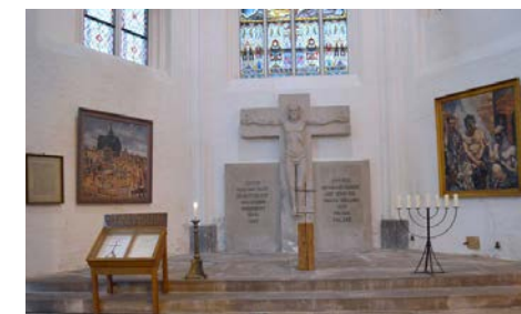
Fotos: Gedenkkapelle in der Marienkirche 1925 (links) und seit 2022 (rechts)